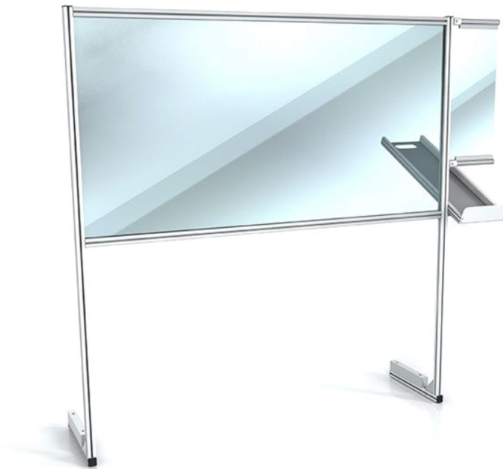
Modularna zaščita pulta z drčo za dvig blaga / Modular counter protection with dispensing chute