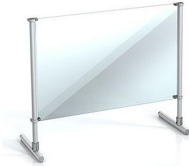
Enostavno nastavljiva prozorna delilna stena brez okvirja / Easily adjustable, frameless transparent partition