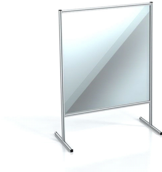
Lahka zaščita za pult s ploščo iz pleksi stekla / Lightweight countertop guard with plexiglass panel