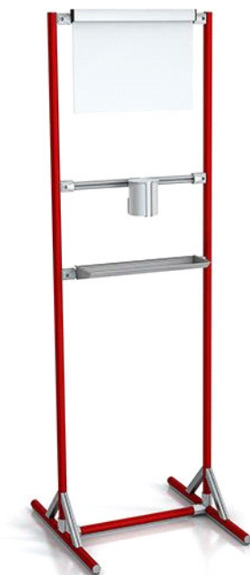
Prostostoječe stojalo za dezinfekcijo rok z informacijsko tablo A3 / Freestanding hand sanitiser stand with A3 information board