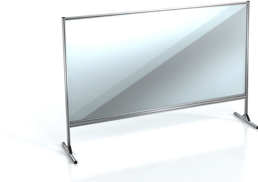
Širok in robusten ščitnik za pult / Wide and resilient countertop guard