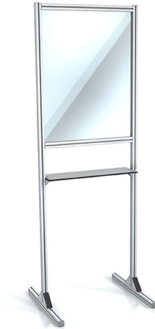
Varovalna stena pred kapljično infekcijo, s polico / Full-height guard with shelf against droplet infection