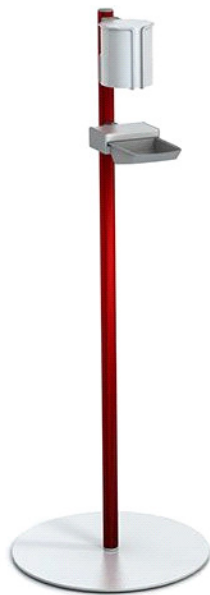
Kompaktno in stabilno stojalo za dezinfekcijo rok / Compact and stable hand sanitiser stand