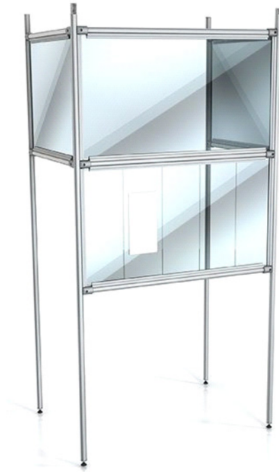
Tristranska zaščitna stena s servisno odprtino za izdajo blaga / Three-sided protective wall for the checkout area with service opening